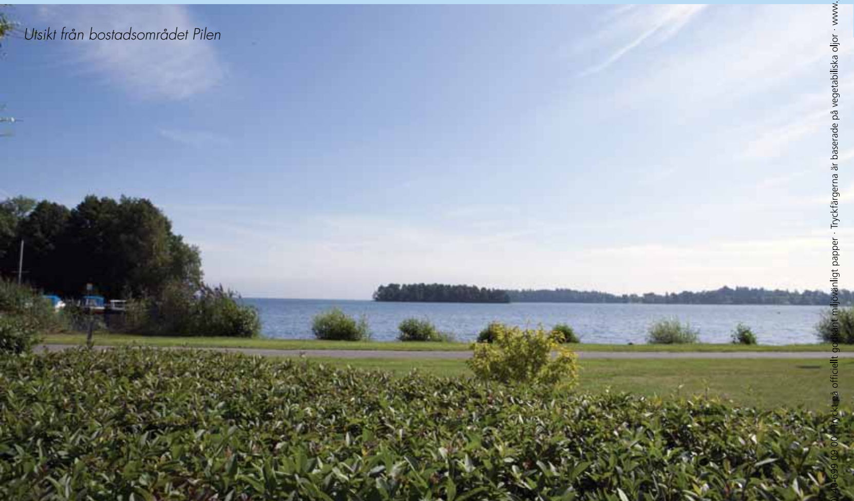
Utsikt från bostadsområdet Pilen